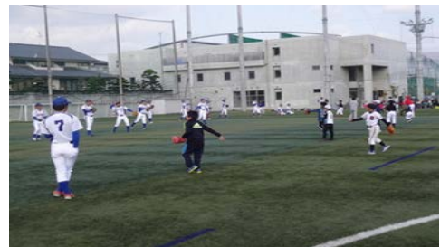
「大経大キッズカレッジ2017 野球教室」

大阪経済大学は、この取り組みを通じて地域社会に寄与し、参加した子どもたちと本学とのつながり、子どもたち同士のつながり、家族とのつながりなど「つながる力」が広がる機会を創出したいと考えます。同時に、学生たちが、地域社会の人々とのふれあいを通じて得られる教育的効果の向上を図っていきたく考えています。