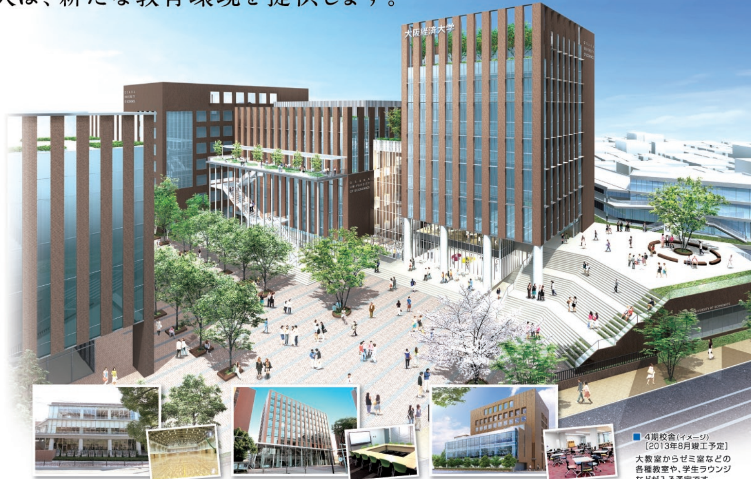
■ 学生会館 [2010年竣工]

法的環境を理解せずに、ビジネス活動を行うことはできません。「ビジネス法能力」を獲得して初めて、ビジネスパーソンとしてスタートラインに立つことができるようになります。