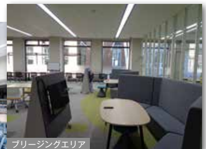
ブリージングエリア