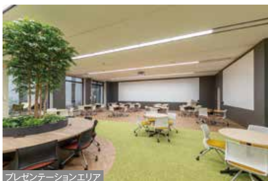
プレゼンテーションエリア

プレゼンテーションエリアは、180インチの大画面を投影できるICT空間です。セミナーやワークショップ、ポスターセッションの開催など、多目的な利用が可能です。随所に置かれたグリーンによって、集中力アップやリラックス効果を得られ、コミュニケーションも一層深まります。