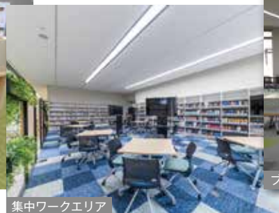
集中ワークエリア