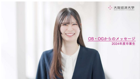
「OB・OGからのメッセージ」就活篇 15秒