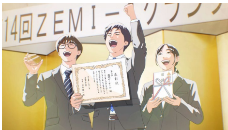
「OB・OGからのメッセージ」ゼミ篇 15秒

交通広告では、キャンパスにおける「人と人が、磨きあう。」日常を、ダイレクトに切り取った6種類のビジュアルを展開します。