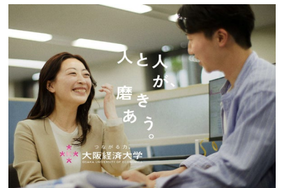
阪急電車 車内ドア横