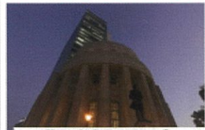
北浜キャンパス(サテライト)・大隅キャンパス 両キャンパス就学

★2019年4月に向けて、収容定員の変更に 伴い、入学定員は+10名の50名となります。